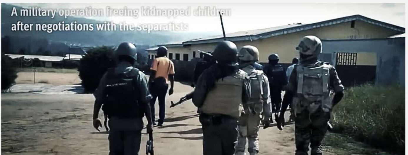
A military operation freeing kidnapped children after negotiations with the separatists